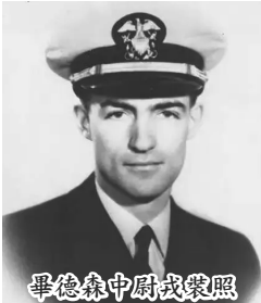
畢德森中尉戎裝照

紀錄片《美國山》(American Mountain)，講述二戰期間，一位美軍援華情報官威廉畢德森中尉(William Wallace Watson)，從印度乘飛機到重慶的途中，因飛機故障迫降而死。那裡是中國貴州黔东南一個侗族( The Kam People)聚居的地方。當地人把他葬在一座風水很好的山上，立了一塊中英文墓碑，那裡後來被稱為「美國山」。不久，美軍將他的屍體運回美國，安葬在他的故鄉明尼蘇達(Minnesota)。